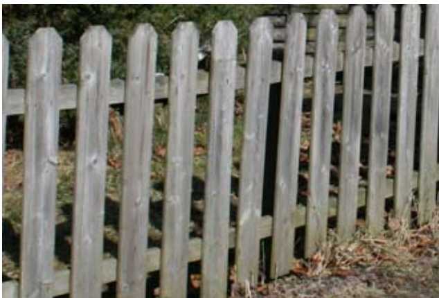
Exempel på staket som är öppet till mer än 1/3.

Tänk på att staket, plank och murar inte får placeras så att de hindrar sikten vid utfarter och korsningar. Samma regler gäller för häckar och buskage på din tomt.