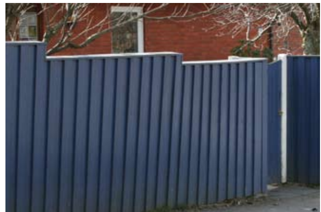
Exempel på plank.